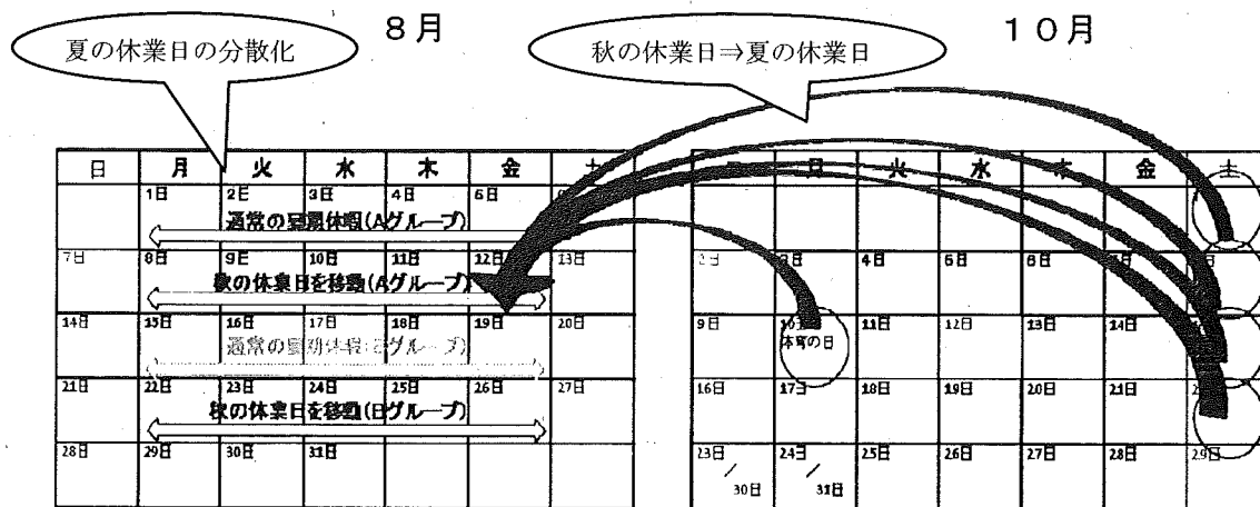
(図2) 秋以降の休業日を夏に振り替えること等による休業分散化・長期化の例

また、特に電力需要が落ち込むお盆の時期や週末に操業をシフトさせることは、東京電力・東北電力管内の最大電力の合計を抑制することにつながる。